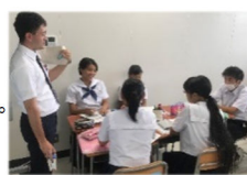
担当教員からのアドバイス

志望学部・学科に準じた課題を設定し、探究的に研究し、プレゼンテーションを行います。また、個人論文にまとめます。