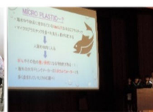
学年プレゼンテーション