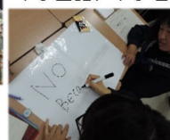
英語で意見をまとめる