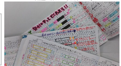
卒業生が残した「夢に向かって」

※「夢に向かって」は、毎日の学習記録帳です。生徒は毎日記録をつけることで自ら目標を設定して達成のための見通しを持ち、継続的に努力する力を高めています。